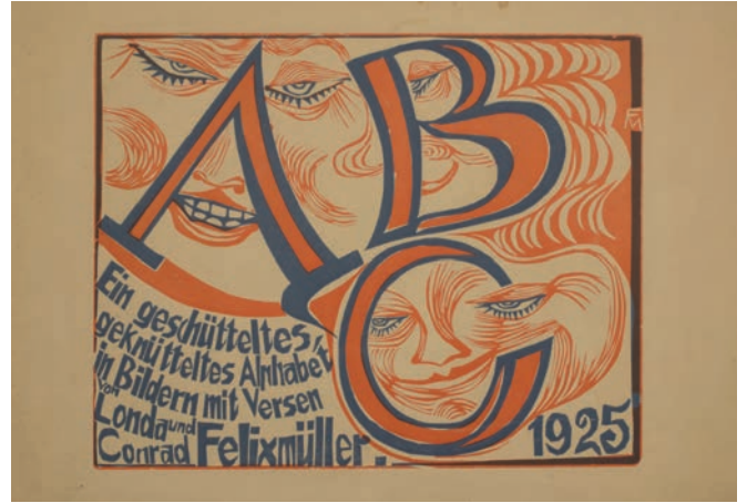
Conrad Felixmüller, Un alfabeto in immagini scosso, smosso /senza senso, con versi di Londa e Conrad Felixmüller , 1925 Frontespizio: xilografia a due colori su carta | Pagine: 13 xilografie acquerellate su carta, ca. 20 x 25 cm, 1957 Matita colorata su carta, 24.6 x 34.3 cm Collezione Werner Coninx, prestito permanente presso il Museo Comunale d'Arte Moderna Ascona