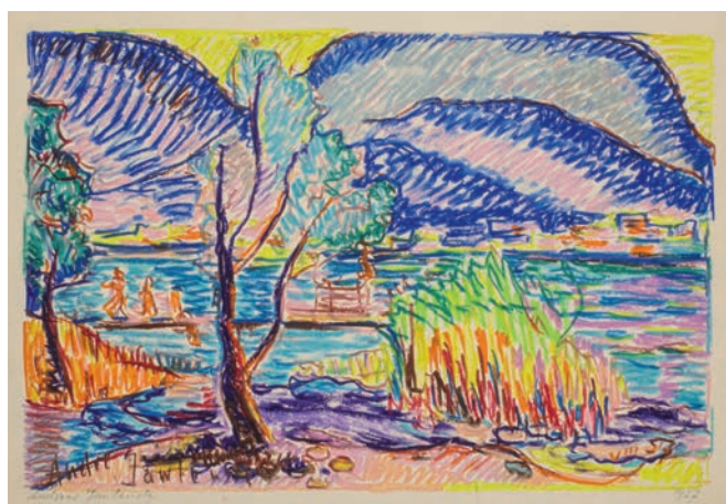
Andreas Jawlensky, Paesaggio ticinese , 1957 Matita colorata su carta, 24.6 x 34.3 cm Collezione Werner Coninx, prestito permanente presso il Museo Comunale d'Arte Moderna Ascona