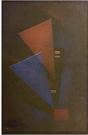
Wassily Kandinsky, Composizione di triangoli , 1930 Gouache su carta incollata su cartoncino, 51.1 x 32.6 cm Collezione Werner Coninx, prestito permanente presso il Museo Comunale d'Arte Moderna Ascona

Obiettivi: usare forme geometriche per avvicinarsi all'arte, familiarizzare con il linguaggio musicale, comunicare emozioni attraverso i colori, trovare corrispondenze tra colori e musica.