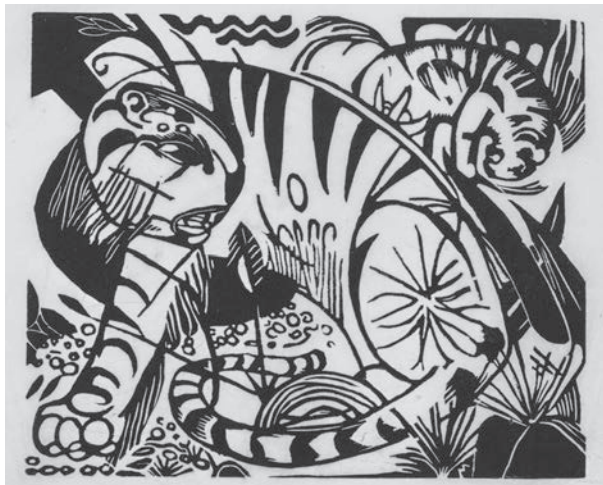
Franz Marc, Tigre , 1912 Xilografia su carta, 20 x 24 cm, 24.8 x 34.2 cm (foglio) Collezione Werner Coninx, prestito permanente presso il Museo Comunale d'Arte Moderna Ascona

Obiettivi: riconoscere aspetti del patrimonio culturale locale e internazionale, esprimersi e formulare ipotesi, riconoscere il valore del linguaggio figurativo per apprendere e progredire.