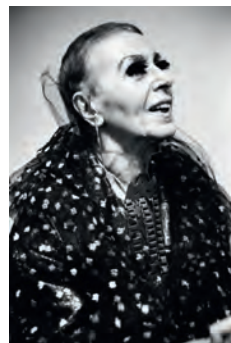
L'artista nella sua mostra allo Studio Marconi nel 1973

The artist in her exhibition at Studio Marconi in 1973