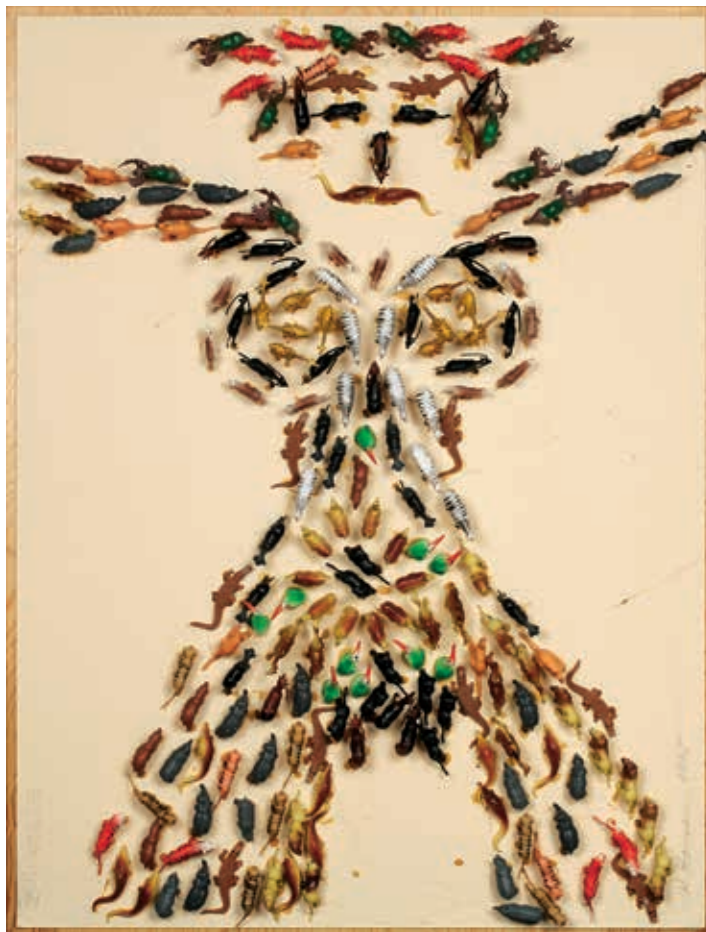
Al Hansen Zoo Venus, 1995 Dauerleihgabe Sammlung Kelter, Staatliches Museum Schwerin / Ludwigslust / Güstrow