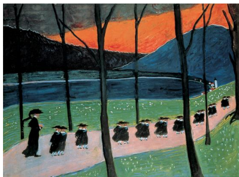
Marianne Werefkin Autunno / Scuola , 1907 Fondazione Marianne Werefkin, Museo Comunale d'Arte Moderna, Ascona