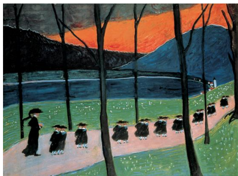
Marianne Werefkin Autunno / Scuola , 1907 Fondazione Marianne Werefkin, Museo Comunale d'Arte Moderna, Ascona