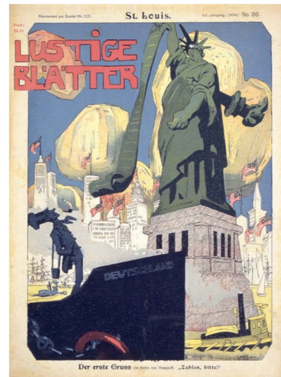
Lyonel Feininger St. Louis 1904

Accanto ai suoi dipinti a olio vi sono poi, di pari importanza, i suoi acquerelli. Questi vengono realizzati in estate, mentre l'inverno è solitamente riservato ai lavori su tela. Scorcii della costiera, paesaggi marittimi e navi che scivolano sul mare sono i soggetti preferiti per gli acquerelli. Persone eleganti che passeggiano, secondo lo stile Biedermeyer, prese in prestito dalle sue caricature giovanili, inizialmente sono ancora poste in primo piano, come soggetti principali della composizione; con il passare del tempo vengono invece relegate in secondo piano, diventando più piccole a favore della vastità infinita del paesaggio.