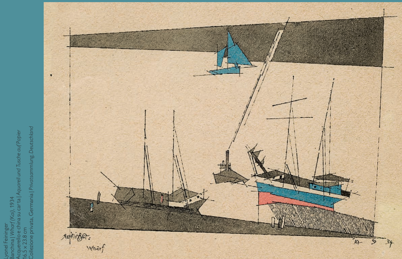
Lyonel Feininger Banchina | Wharf (Kaj), 1934 Acquerello e china su carta | Aquarell und Tusche auf Papier 16,5 x 23,8 cm Collezione privata, Germania | Privatsammlung, Deutschland